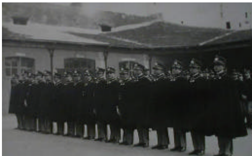
Qualcuno riesce a datare questa foto?

Sulla base dei dati che ci sono stati ammanniti, la visita al complesso urbano ha assunto un interesse veramente segnato e soprattutto istruttivo.